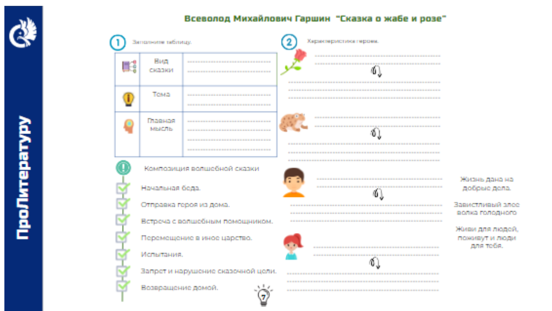
Рис. 2 Страница презентации к учебному занятию по курсу «ПроЛитературу»