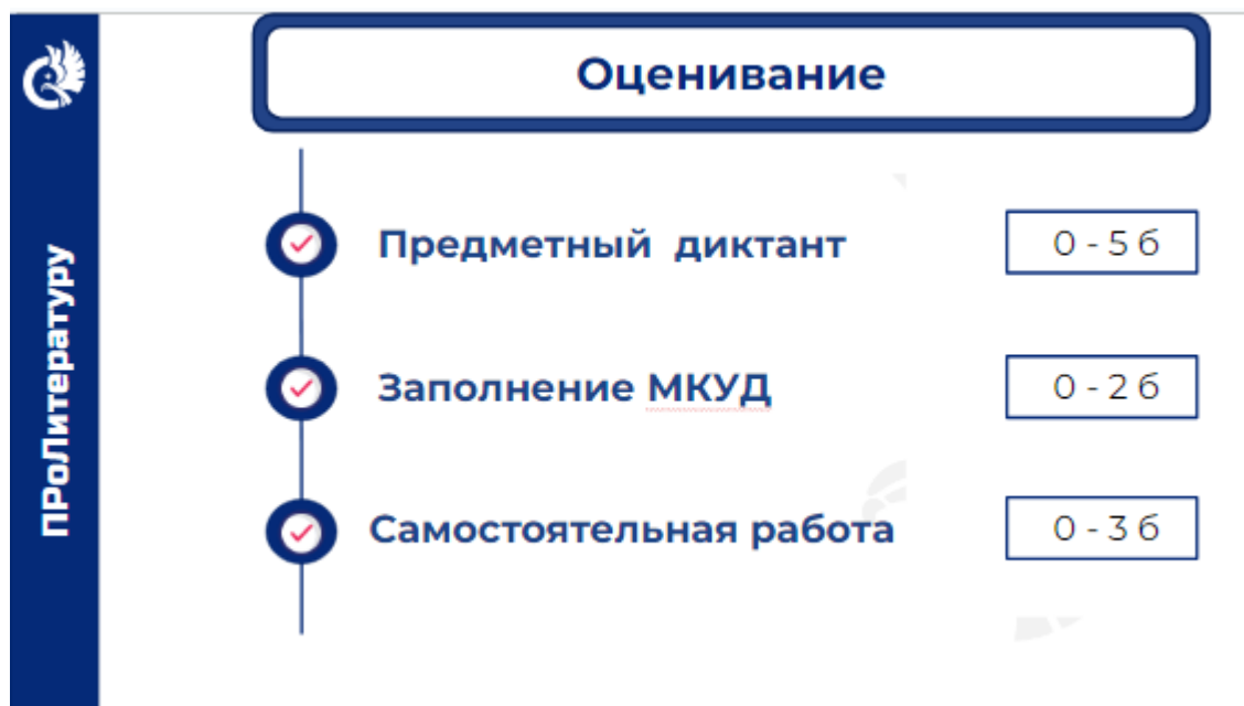
Рис. 3 Страница презентации к учебному занятию по курсу «ПроЛитературу» с представлением элементов оценивания обучающихся