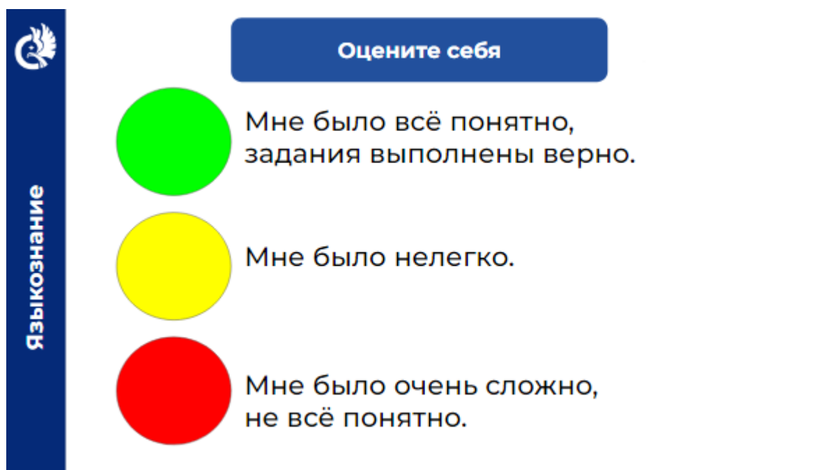
Рис. 4 Страница презентации к учебному занятию по курсу «Языкознание» с представлением элементов рефлексии образовательной деятельности